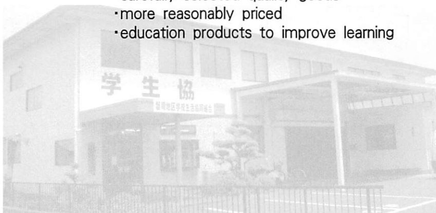
Banshu Student Union access map